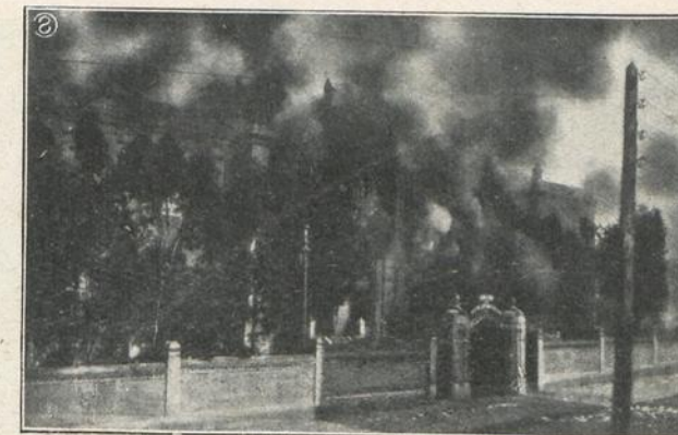
MADRID: COLEGIO DE NUESTRA SEÑORA DE LAS MARAVILLAS, EN LOS CUATRO CAMINOS