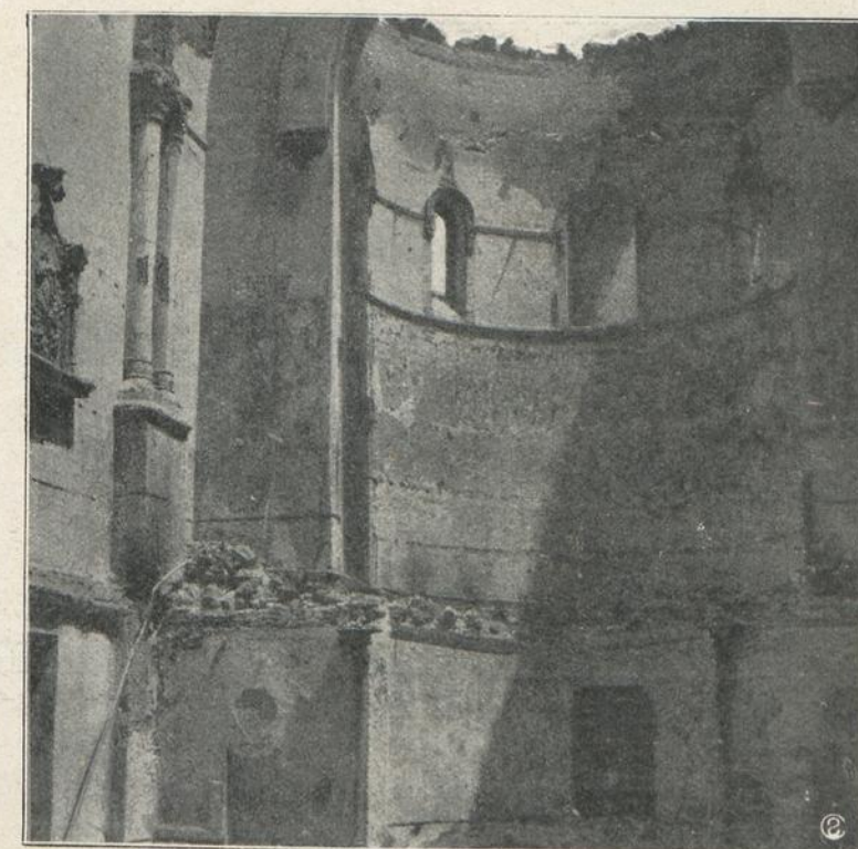
MADRID: ESTADO EN QUE QUEDARON LA BOVEDA Y PAREDES DE LA CAPILLA DEL COLEGIO DE NUESTRA SEÑORA DE LAS MARAVILLAS, DE HH. DE LA DOCTRINA CRISTIANA