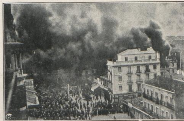
MADRID: CONVENTO DE RELIGIOSAS MERCEDARIAS, EN LOS CUATRO CAMINOS