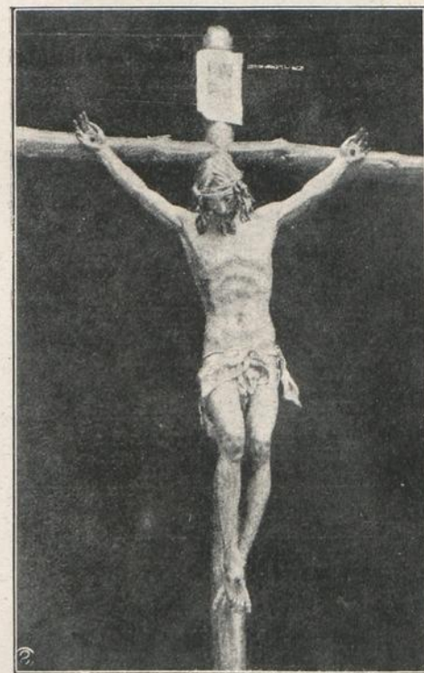
MALAGA: EL SANTO CRISTO, DE PEDRO DE MENA, DESTRUIDO EN LA PARROQUIA DE SANTO DOMINGO