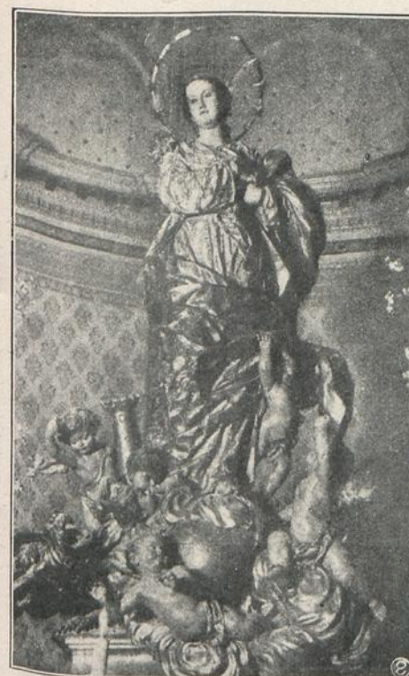
MURCIA: LA INMACULADA CONCEPCION, DE SALLILLO, DESTRUIDA EN EL TEMPLO DE PADRES FRANCISCANOS