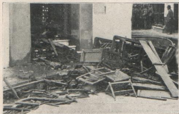
SEVILLA: RESTOS DE IMAGENES, CUADROS Y OBJETOS DEL CULTO, DESTRUIDOS EN LA CAPILLA DE SAN JOSE