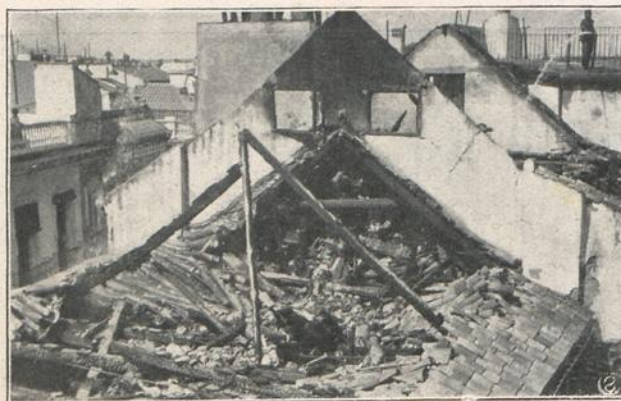
SEVILLA: TECHUMBRE DE LA CAPILLA DE SAN JOSE, DESTRUIDA POR EL INCENDIO