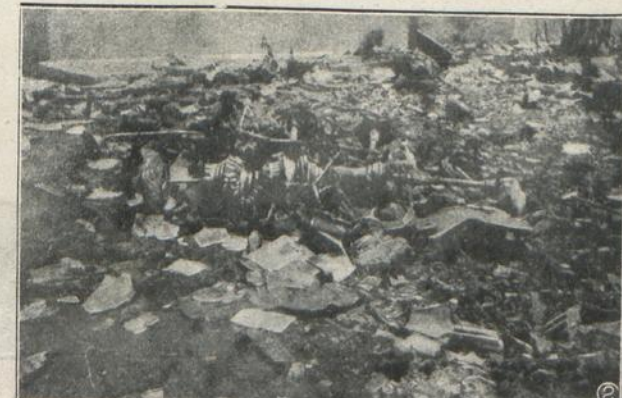
MADRID: IMPONENTE MONTON DE ESCOMBROS, EN LA IGLESIA DEL SAGRADO CORAZON, DE CHAMARTIN.