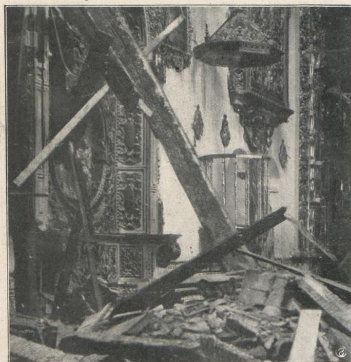
SEVILLA: VISTA INTERIOR DE LA CAPILLA DE SAN JOSE, DECLARADA MONUMENTO NACIONAL, DESPUES DE INCENDIADA POR LAS TURBAS