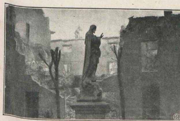
MADRID: ESTADO EN QUE QUEDO EL PATIO DEL CONVENTO DE CHAMARTIN