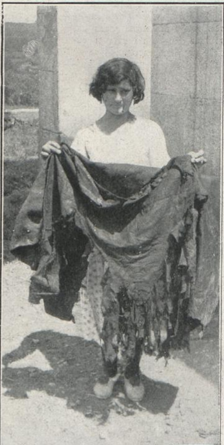
IGLESIA PARROQUIAL DE OLEIROS: VENTANA POR DONDE ARROJARON LA BENCINA, PRENDIENDOLE FUEGO.—UNA MUCHACHA DE LA PARROQUIA DE IÑAR MUESTRA LO ÚNICO QUE SE SALVO DE LAS VESTIDURAS SAGRADAS.