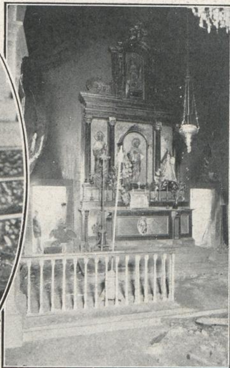
ALTAR DE LA IGLESIA DE SIGRAS, INCENDIADA POR LOS REVOLTOSOS, QUE DEJARON ABANDONADO AL PIE DEL MISMO UN BIDON DE BENCINA.—LA IMAGEN DE LA VIRGEN DEL CARMEN, SACRILEGAMENTE MUTILADA POR LOS INCENDIARIOS ANTES DEL INCENDIO DE LA IGLESIA DE IÑAR, DONDE ERA VENERADA.—ALTAR DEL SAGRADO CORAZON, DE LA IGLESIA DE SAN PEDRO DE NOS, DESTRUIDA PARCIALMENTE POR EL INCENDIO.